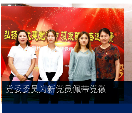
党委委员为新党员佩戴党徽